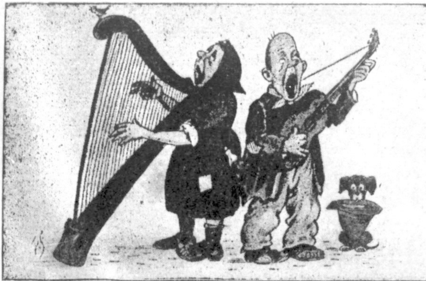
Muzicanții: (In cor — Ce de CURIOSITĂȚI și de ANIMOZITĂȚI, „Toată vara-m strigat ura!... Dar acum, am... băgat-o pe mână!”.